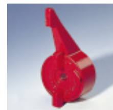
Optional mit selbstschließendem Branschutzgriff Firesafe lieferbar.