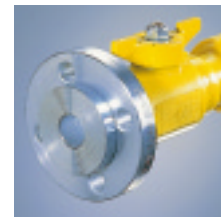
HSP/F-SKDFL GTN mit Losflansch nach DIN 2673