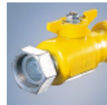
HSP/F-SKDRV GTN mit Reglerverschraubung nach DIN 2993