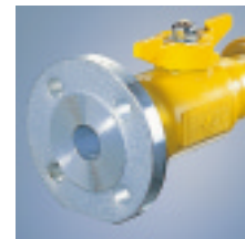
HSP/F-SKDF GTN mit Festflansch nach DIN 2633