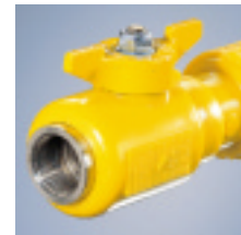
HSP/F-SKD GTN mit Gewinde nach DIN 2999