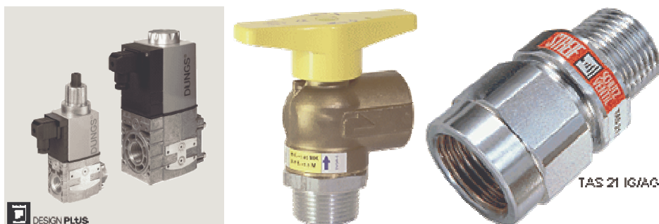
Mágnesszelepek, áramláskorlátozó szerelvény, hőre záró elem

Igény esetén a bemenő oldali hőre zárás és az áramláskorlátozó funkció a gáznyomás-szabályozó része is lehet, de gyártanak fali átvezető elemet is hőre záródó gömbcsappal.