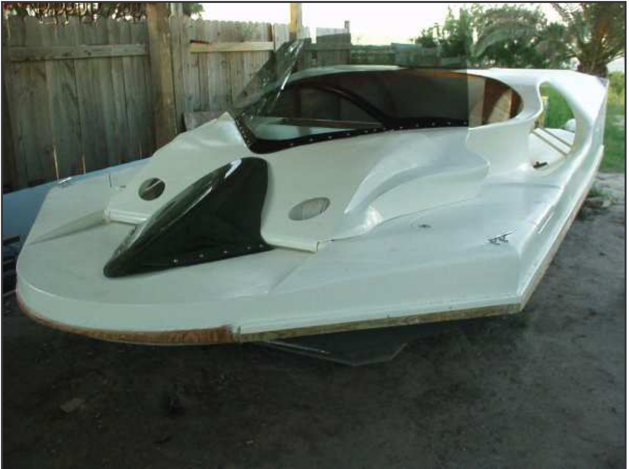
Alpha-II típusú légpárnáshajó

Éppen az ellenkezője az igaz abban az esetben, ha csatorna a hajónk rögzített részegysége és ezért a hajótestnek, akár csak a burkolat, szilárdságot ad. Bizonyos szempontból a csatorna, mint a hajó végéhez kapcsolt egység, amely előtt a motort helyezzük el, alacsony sebességű haladás esetén nagy aerodinamikai ellenállást okoz. Azonban ha megpróbáljuk átgondolni a fenti kijelentést, akkor a hajó szerves részét jelentő csatorna nemcsak lapáttörés esetén ad nagy biztonságot, hanem áramvonalasabbá és szilárdabbá is teszi a hajót. Más esetekben (lásd. Alpha-II típusú hajót), az alsó hajótest szerves részeként megjelenő csatorna előnye az „önürítő” fülkekialakítás lehetősége, a csatorna hosszából fakadóan lecsökkent zajszint, a hajótesthez kapcsolt belső borítás, a jobb manőverezést biztosító, integrált irányítófelületek, és az aerodinamikailag kedvezőbb kialakításból fakadó kisebb ellenállás és nagyobb tolóerő.