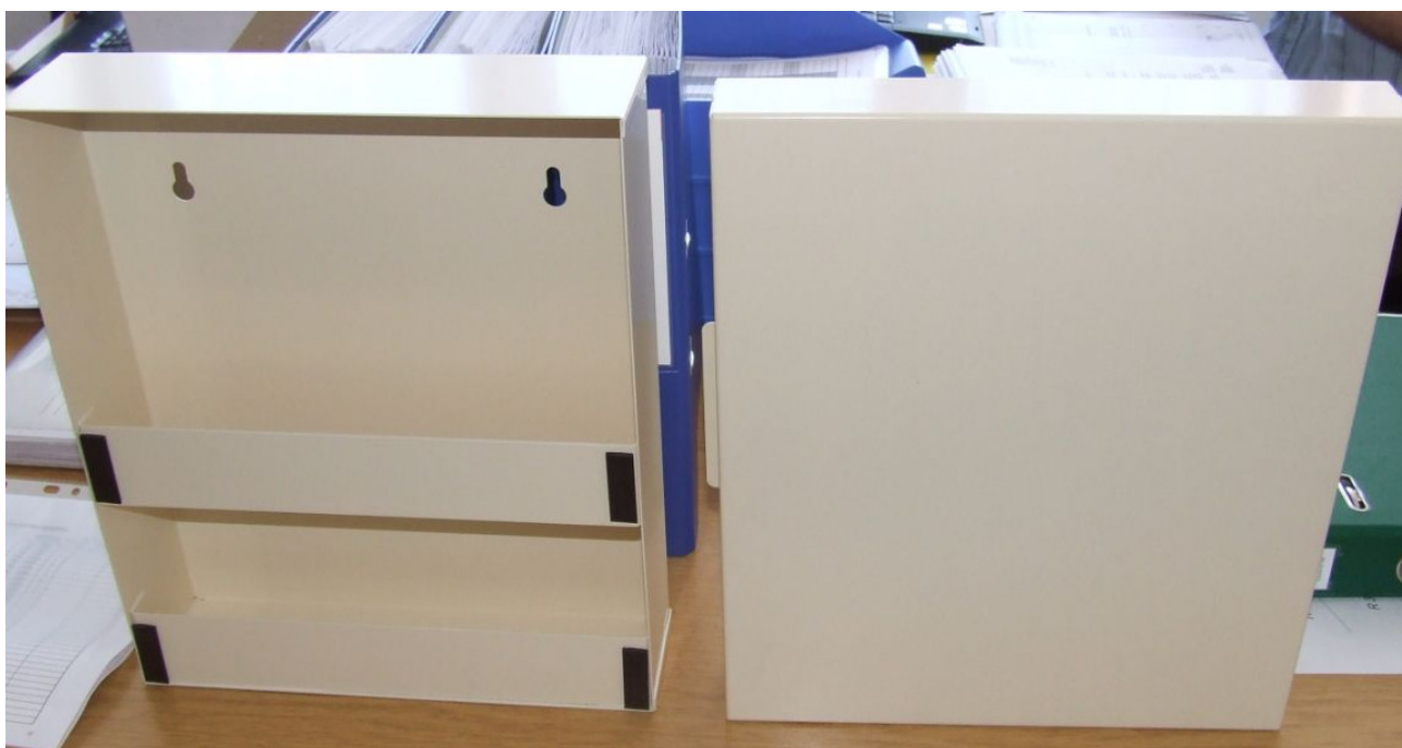
1. ábra hátlap és előlap fénykép